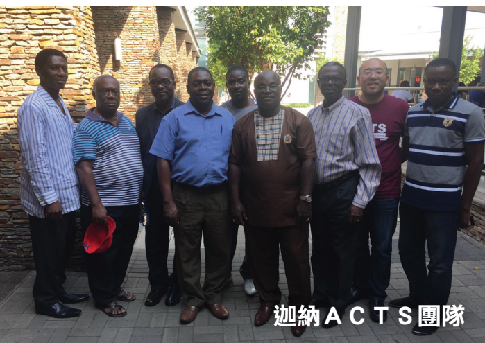
迦納 ACTS 團隊