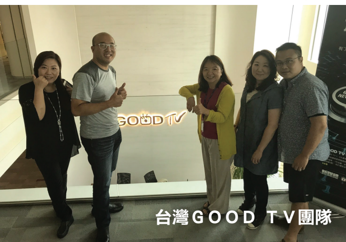
台灣 GOOD TV 團隊